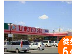
ドラッグストア ひまわり 御幸店