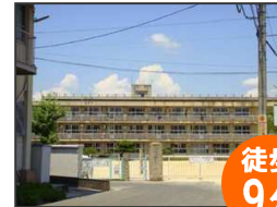
福山市立御幸小学校